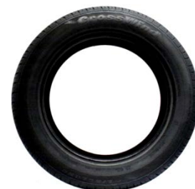
Рас. 3 – намуд аз бар