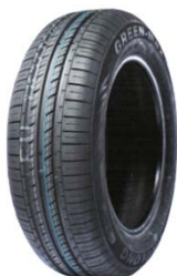
Рас. 2 – намуди умумӣ \frac{3}{4}