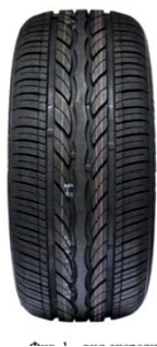
Рас. 1 – намуд аз пеш