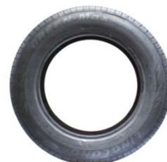
Рас. 3 – намуд аз бар