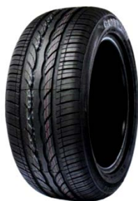
Рас. 2 – намуди умумӣ \frac{3}{4}