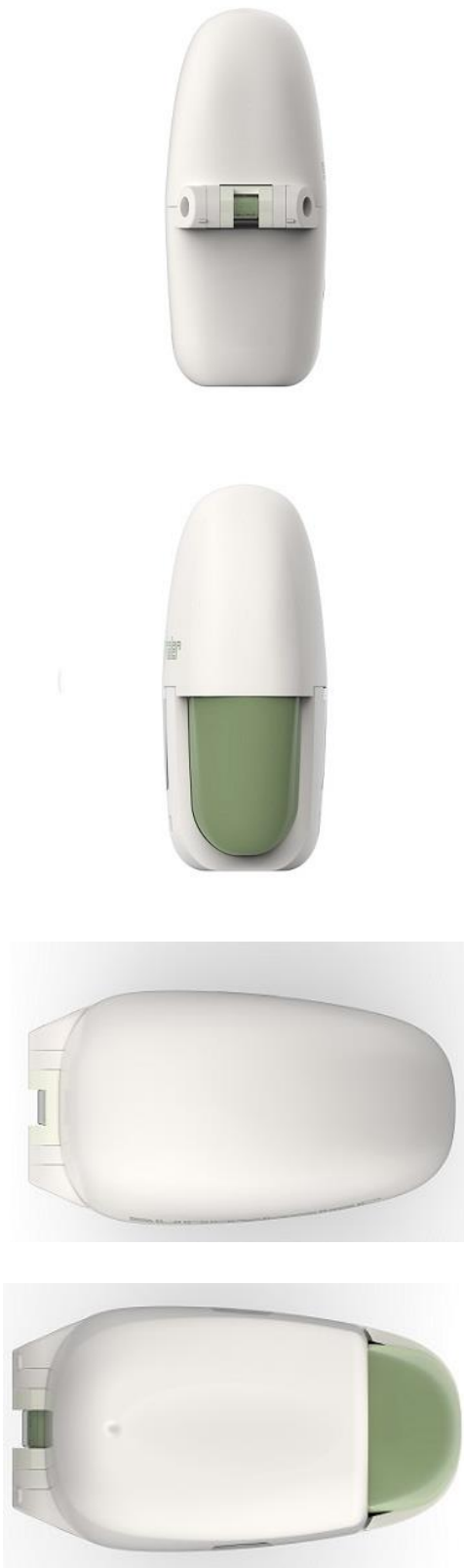
Ингалятор (вариант 2)